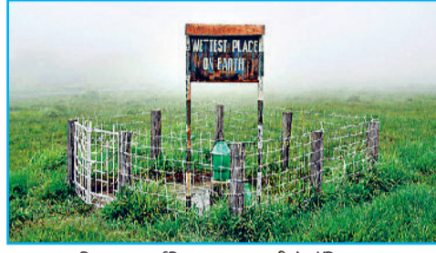
दुनिया का सर्वाधिक नम स्थान भी है मौसिनराम