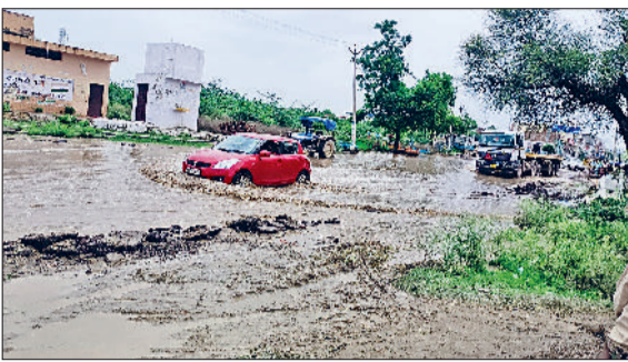
बवानीखेड़ा। बवानी खेड़ा में बारिश का जमा पानी व निकलते हुए वाहन।

खातमें के कगार पर हैं। अगर निकासी नहीं हुई तो किसानों को अगले एक दो दिनों में पानी की खरीफ की फसलों से हाथ धोना