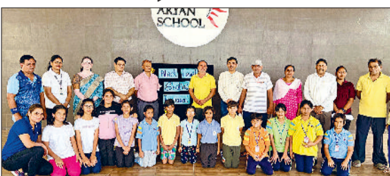
भिवानी। विजेता प्रतिभागियों के साथ खिलाड़ी।

भौम स्ट्रेडियम में आयोजित करवाए जा रहे दो दिवसीय खंड स्तरीय स्कूली खेल प्रतियोगिता दूसरे दिन शनिवार को उत्साहपूर्वक समापन हो गया। इस दौरान अंडर-11 व अंडर-14 वर्ग की बालिकाओं ने विभिन्न खेल प्रतियोगिताओं में भाग लेते हुए खेल भावना, अनुशासन और टीम भावना का परिचय देते हुए बेहतरीन प्रदर्शन किया। प्रतियोगिता में दौड़, कबड्डी, खो-खो, लांग जंप, थ्रो बॉल आदि खेलों में बालिकाओं ने भाग लिया।