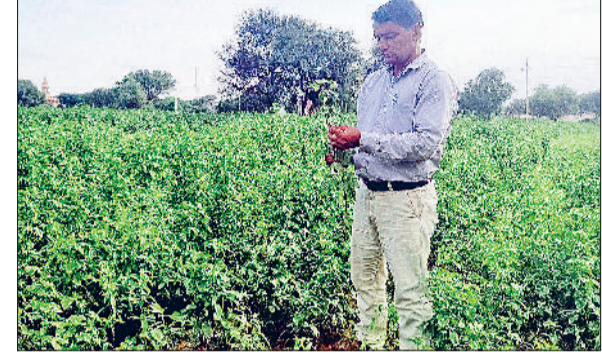
लोहारू। ग्वार फसल का निरीक्षण करते अधिकारी।

आधे से ज्यादा बच्चे कर रहे हैं छुट्टी। स्कूल के भवन व परिसर में बारिश का पानी जमा होने की वजह से शिक्षक को समय पर स्कूल में पहुंच रहे हैं, लेकिन स्कूलों में पानी जमा होने का बहाना बनाकर बच्चे छुट्टी कर रहे हैं। फिलहाल जिन स्कूलों में बारिश का पानी जमा है। उन स्कूलों में बच्चों को हाजिरी आधी से भी कम है। बार बार शिक्षकों के कहने के बावजूद भी बच्चों की संख्या नहीं बढ़ पा रही है। स्कूलों में जमा पानी की निकासी के बाद ही बच्चों की संख्या में इजाफा हो पाएगा। के कमरों व बरामदों में आधा आधा पानी के बीच से होकर निकलना फुट तक पानी जमा है। जिसके चलते स्कूल टीचर व बच्चों को के सरकारी स्कूल की बनी है।