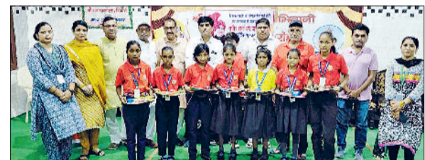
भिवानी। बच्चों में लेखन सामग्री वितरित करते हुए।