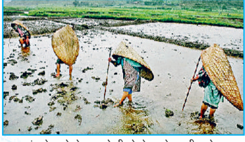
बांस के छत्ते से खुद को भीगने से बचाते स्थानीय लोग

सवाल है आखिर मौसिनराम में दुनिया की सबसे ज्यादा बारिश कैसे होती है? जबकि दुनिया में सबसे ज्यादा बारिश वाली जगहें आमतौर पर भूमध्य रेखा के आस-पास होती हैं। दुनिया में भौगोलिक रूप से देखा जाए तो सबसे ज्यादा बारिश दक्षिण अमेरिका, मध्य-पश्चिमी अफ्रीकी देशों और कुछ दक्षिण-पूर्वी एशिया के देशों में होती है। फिर मौसिनराम ने दुनिया में सबसे ज्यादा बारिश की बाजी कैसे मार ली? इसका जवाब है कि आमतौर पर मई से सितंबर तक यहां जो बारिश होती है, उसका सबसे बड़ा कारण इस गांव की अपनी खास भौगोलिक स्थिति है। शिलांग से लगभग 60 से 65 किलोमीटर दूर उत्तर पूर्वी दिशा में खासी पहाड़ियों के बीच बसा यह गांव अपनी विशेष स्थिति के कारण दक्षिण-पश्चिम मानसून के दौरान पानी से भरी बदलियों का डेरा बन जाता है। खासी पहाड़ियों की खास स्थिति इन पानी से भरी बदलियों को आबधन के लिए रोकती है और ठीक तभी बंगाल की खाड़ी से आने वाली गर्म और नम हवाएं इन्हें यहां झूमकर बरस जाने के लिए मजबूर कर देती हैं। 1491 मीटर