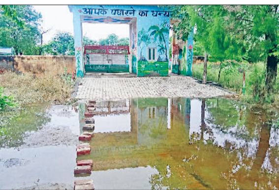
तोशाम। तालु गांव में रिहायशी क्षेत्र में जमा पानी।