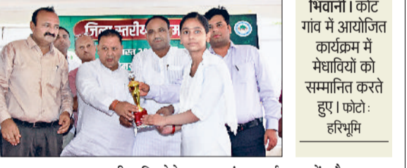
भिवाणी। कोट गांव में आयोजित कार्यक्रम में मेधावियों को सम्मानित करते हुए।

विधायक घनश्याम सर्राफ ने कहा कि आज पर्यावरण का संतुलन निरंतर बिगड़ता जा रहा है। पर्यावरण के संतुलन को बनाए रखने के लिए अधिक से अधिक पेड़ लगाने जरूरी हैं। इसलिए हमें एक पेड़ अपनी मां के नाम जरूर लगाना चाहिए। पेड़ लगाने के साथ-साथ उनका संरक्षण भी बहुत जरूरी है। विधायक सर्राफ शनिवार को गांव कोट के बाबा कांशी धाम परिसर में आयोजित जिला स्तरीय वन महोत्सव को बतौर और मुख्य अतिथि संबोधित कर रहे थे। इस दौरान उन्होंने गांव के विकास के