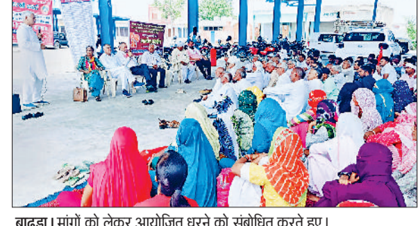
बाढ़ड़ा। मांगों को लेकर आयोजित धरने को संबोधित करते हुए।